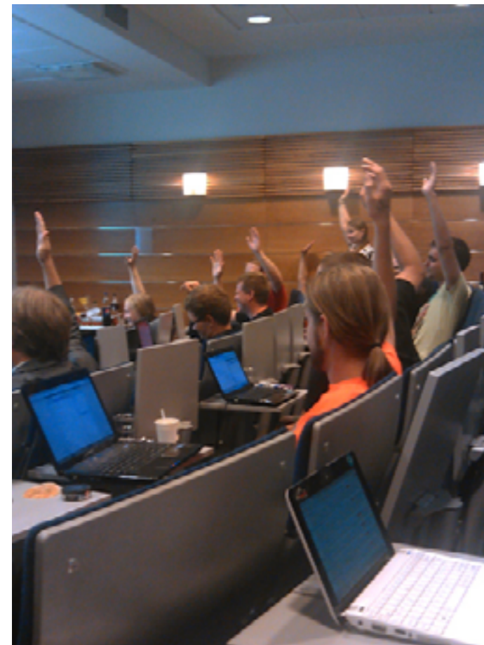
Äänestys käynnissä heinäkuun puoluekokouksessa

http://piraattipuolue.fi/agenda/puolueohjelma