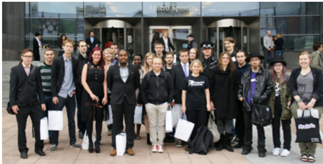
Young pirates outside the EU parliament

Writer is vice chairperson of Piraattinuoret and board member of Young Pirates of Europe.