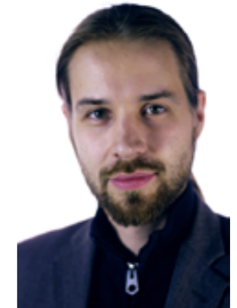
Kirjoittaja on piraattipuolueen eurovaaliehdokas ja Varsinais-Suomen piiriyhdistyksen puheenjohtaja