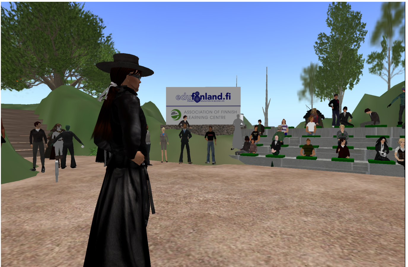
Kansanedustaja Jyrki Kasvin virtuaalihakmo yleisönsä edessä Second life -virtuaalimaailmassa järjestetyssä vaalitilaisuudessa. Järjestelmä voisi soveltua myös etäkokouksien järjestämiseen.